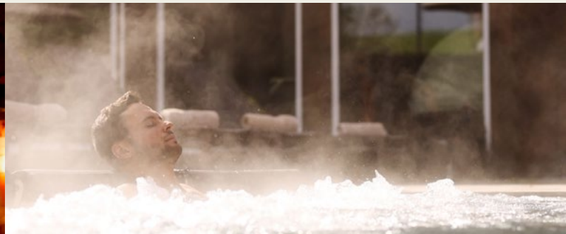
mit Massagedüsen und Sprudelliegen