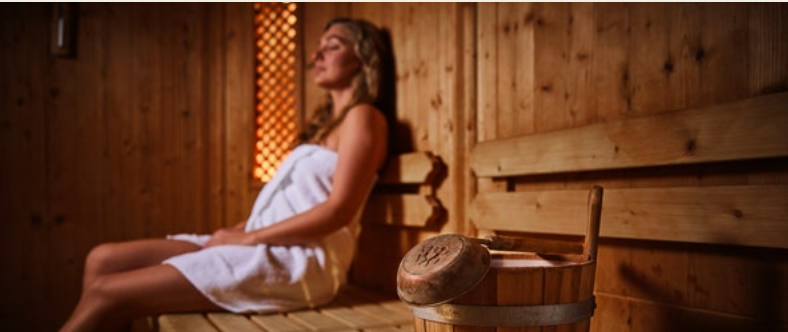
Finnische Sauna, Bio-Sauna