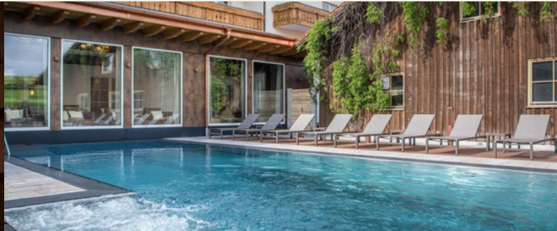
ganzjährig beheizter Außenpool