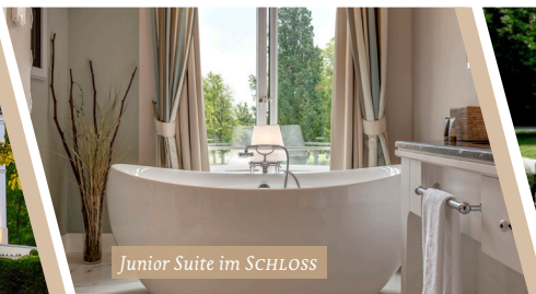
Junior Suite im SCHLOSS